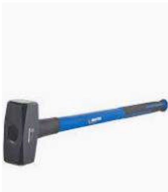
Masse Marque : Dexter Contient : 1 masse